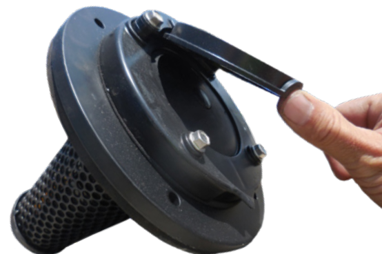
closed-end filter met afbuigkap