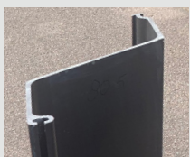
Type FRP Z610